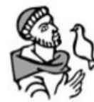
Parochie St. Franciscus van Assisië Boekelo-Buurse-Haaksbergen