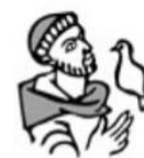
Parochie St. Franciscus van Assisië Boekelo-Buurse-Haaksbergen