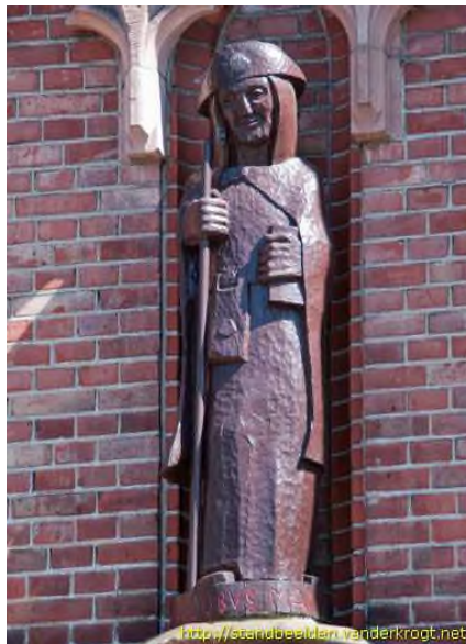
Houten van de kerk beeld van H. Jacobus boven de ingang.

De pastoraatgroep vergadert om de vijf a zes weken. Voor vragen of inlichtingen over de pastoraatgroep kunt u e-mailen naar: h.jacobuslonneker@knppmail.nl .