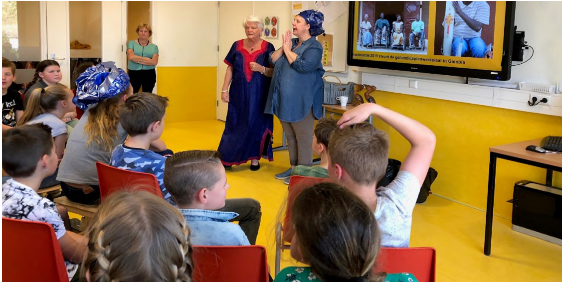
Presentatie op één van de scholen in Afrikaanse klederdracht

Lonneker, in de Ontmoetingskerk (deze viering was oecumenisch) en in Haaksbergen. De MOV-Haaksbergen organiseerde een veiling waarvan de opbrengst naar de Vastenactie ging. Ook was er in Haaksbergen de Engelse mijlenloop. Ook dit leverde veel geld op omdat de lopers gesponsord werden. In de St. Janskerk aan de Haaksbergerstraat was een mis. In plaats van de preek werden wij geïnterviewd door de pastoor over ons project in Gambia. Ook de Vastenzakjes leverden veel geld op. Er was een speciale avond georganiseerd voor het tellen van het geld.